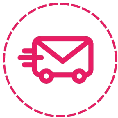
Массовая рассылка писем