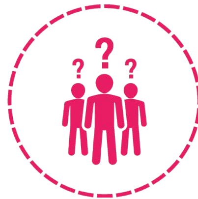
Опросники и анкеты